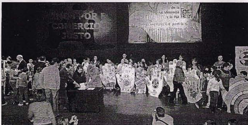
SOLIDARIDAD. Cada centro presentó una mano simbólica para apoyar el comercio justo.

Cuarenta y dos centros educativos de Albacete firman su adhesión al programa 'Colegios por el Comercio Justo'