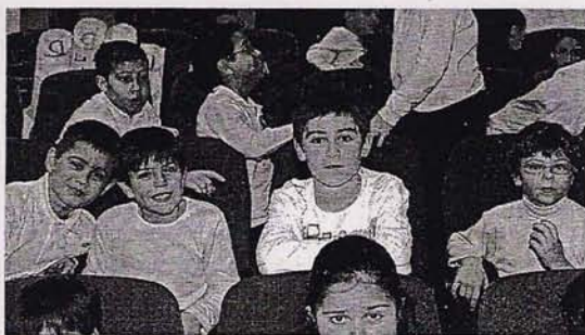
CONCIENCIAR. El Teatro de la Paz acogió a público infantil.

«La paz significa que da igual que un niño sea blanco o negro, porque no hay que discriminar»