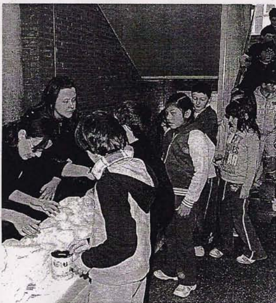
AYUDA. Los niños aportan su euro a cambio de un bocata.

En cambio, para los mayores se programó una actividad para conocer la realidad de Mali. De hecho, desde la Maná reconocen que estas actividades son importantes, «también lo es que llegue el